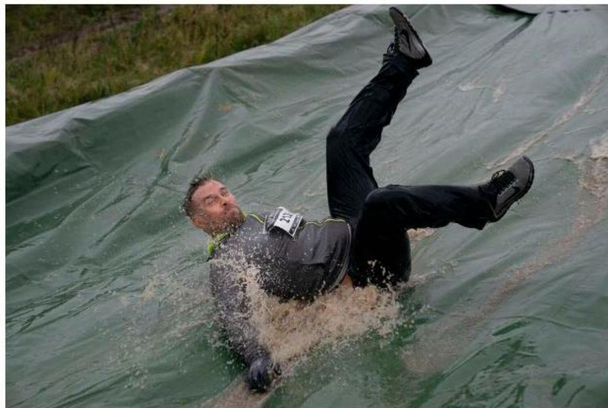
Hvis du endnu ikke har planer for din weekend er her nogle idéer til, hvad du kan bruge den på.

Hvis du endnu ikke ved, hvad du skal foretage dig i weekenden kommer her flere forslag.